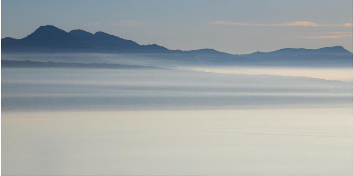
LAKE A PANORAMIC #10 Samedi 3 février 2024, 16h43 Saturday, February 3, 2024, 4:43 pm

Ayant peint les Océans, L'Himalaya, l'Amazone, Fatigué d'avoir vu grand, Dieu créa le bleu Léman. Jean Villard dit Gilles 1895-1982