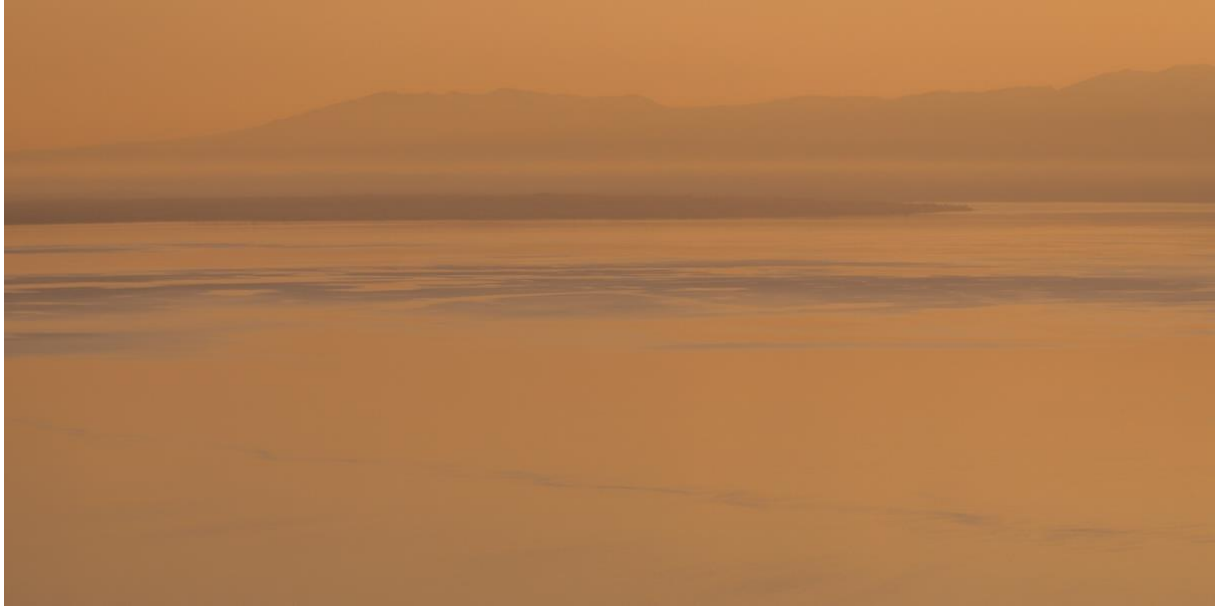
LAKE A PANORAMIC #5 Lundi 29 mars 2021 – 18h57 Monday, March 29, 2021 - 6:57 pm

So quiet and peaceful Tranquil and blissful There's a kind of magic in the air What a truly magnificent view A breathtaking scene With the dreams of the world In the palm of your hand. Freddy Mercury 1946-1991