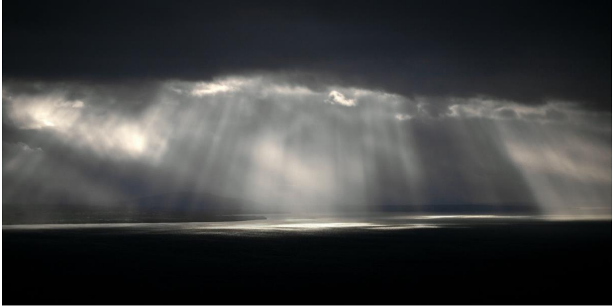
LAKE A PANORAMIC #9 Mardi 31 octobre 2023, 16h37 Tuesday, October 31, 2023, 4:37 pm

Je tenais mes yeux tournés vers le lac ; il était blanc sous le ciel d'automne d'où tombait une fine, mince brume, pareille à une poudre d'argent.... C'est grave, c'est même très grave. Je vis soudain le lac noircir. Au lieu de cette poudre d'argent, il y eut comme de la suie sur le monde. Charles Ferdinand Ramuz 1878-1947