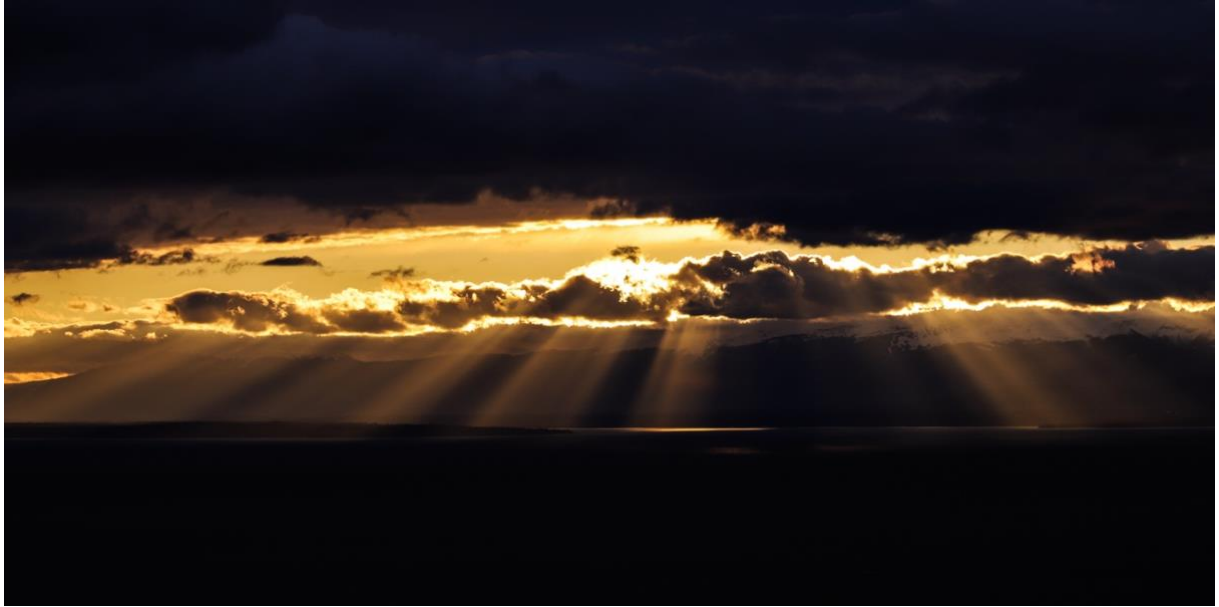
LAKE A PANORAMIC #4 Dimanche 7 février 2021 – 17h43 Sunday, February 7, 2021 - 5:43 pm

Cent jardins sont au-dessous de mon jardin. Le grand miroir du lac les baigne. Je vois toute la Savoie, les Alpes qui s'élèvent en amphithéâtre, et sur lesquels les rayons du soleil forment mille accidents de lumière.