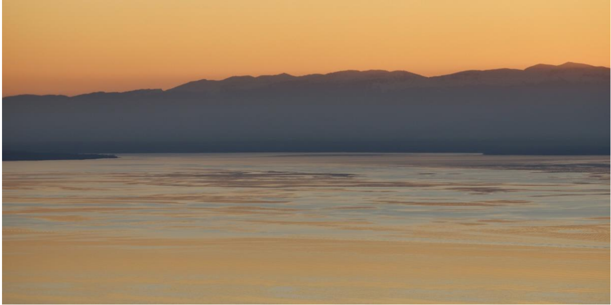
LAKE A PANORAMIC #27 Samedi 3 janvier 2026, 18h24 Saturday, 3 January 2026, 6:24 pm

Il y a urgence ; il y a la lumière, elle va durer dix secondes, donc il y a urgence. Jean-Luc Godard 1930-2022