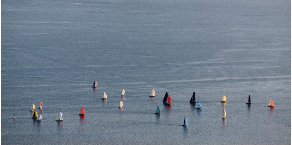
LAKE A PANORAMIC #19 Mercredi 3 septembre 2025, 18h48 Wednesday, September 3, 2025, 6:48 pm

Capitaine Haddock : Il faut tout de suite avertir la police. Nous sommes dans un hélicoptère qui survole le lac Léman et nous poursuivons un canot automobile dans lequel se trouve Tournesol. Il a été enlevé. Hergé 1907-1983