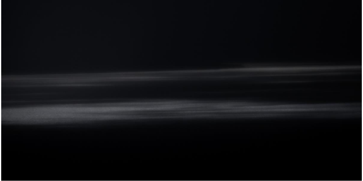
LAKE A PANORAMIC #8 Samedi 1er avril 2023 – 19h39 Saturday, April 1, 2023 - 19:39 pm

Je veux que celui qui regarde le tableau soit avec lui, pas avec moi. Je veux qu'il voie ce qu'il y a sur la toile. Rien d'autre. Le noir est formidable pour ça, il reflète. Les mouvements qui comptent ce sont ceux de celui qui regarde.